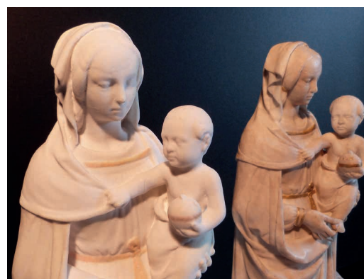
La Vierge à l'Enfant d'Ivroy-le-Pré, impression 3D à gauche et originale à droite