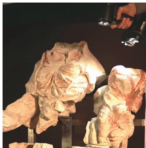
Opération de Scan 3D de La Vierge à l'Enfant de l'ancien couvent des Carmes de Tours

Une introduction présente l'histoire du projet de recherche ainsi que les machines utilisées (scanners 3D, objets imprimés, tests, etc.). La scénographie propose ensuite de découvrir les trois sculptures de Vierge à l'Enfant dans trois salles successives.