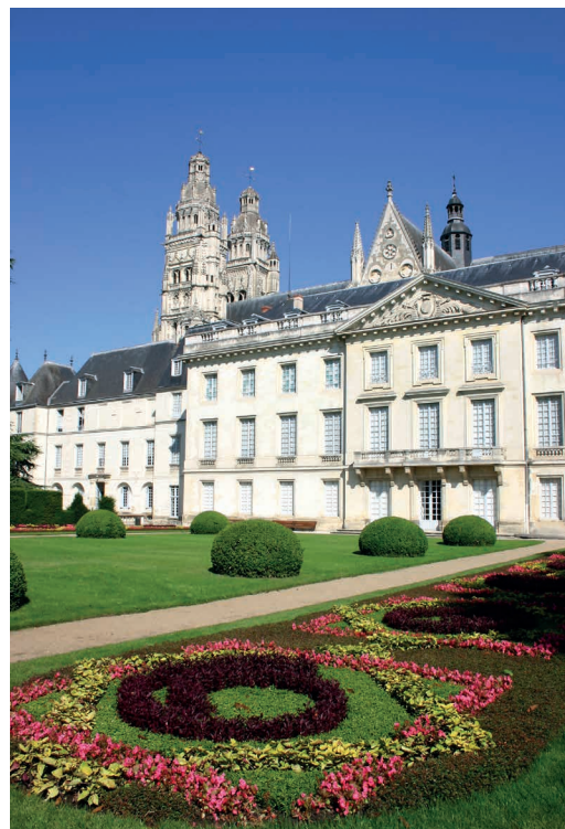
Palais XVII e et XVIII e s, façades sur jardin

La collection d'œuvres du XX e s. regroupe les noms de Geneviève Asse, Pierre Buraglio, Alexander Calder, Maurice Denis, Jacques Monory, François Morellet, Serge Poliakoff, Zao Wou-Ki... rassemblés autour de la donation consentie par Olivier Debré.