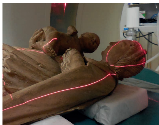
La Vierge à l'Enfant de Blois en phase de scannérisation à l'INRA