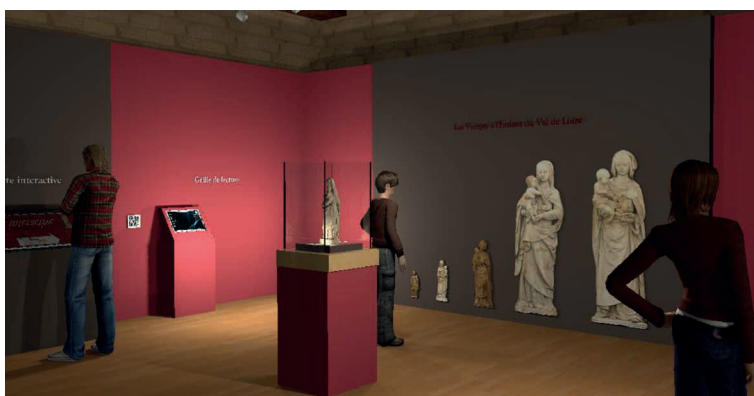
Prévisualisation 3D de la scénographie de l'exposition © Charlotte Fuchs