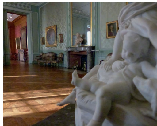
Salon Louis XV