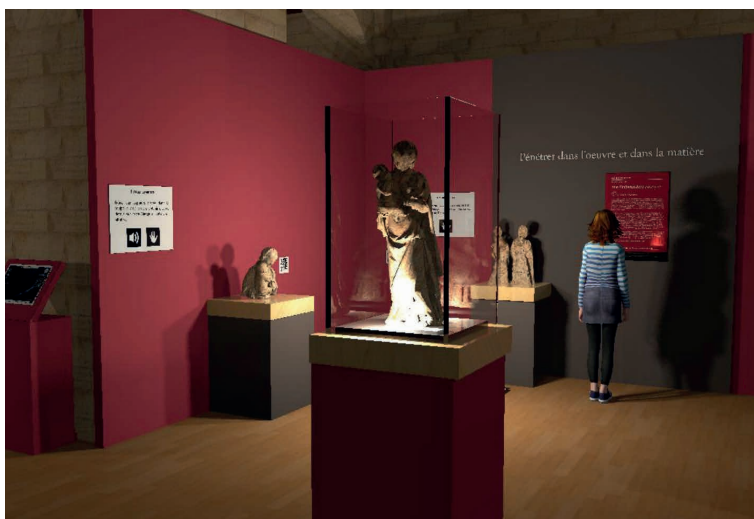
Prévisualisation 3D de la scénographie de l'exposition

Autour de la Vierge à l'Enfant d'Ivoy-le-Pré, plusieurs interfaces évoquent cette iconographie telle qu'elle s'est développée en Val de Loire à la Renaissance. La 3D permet de convoquer virtuellement des œuvres non présentes dans l'exposition, dont deux grandes statues conservées au Louvre, la Vierge à l'Enfant d'Écouen et la Vierge à l'Enfant d'Olivet.