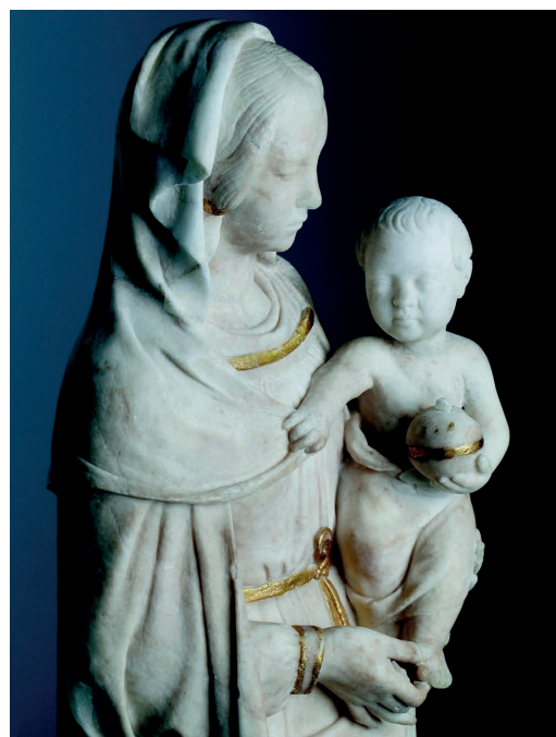
La Vierge à l'Enfant d'Ivoy-le-Pré (détail) Touraine, vers 1520 Albâtre, dorure moderne (XIX e s.), 51 x 16 x 11 cm