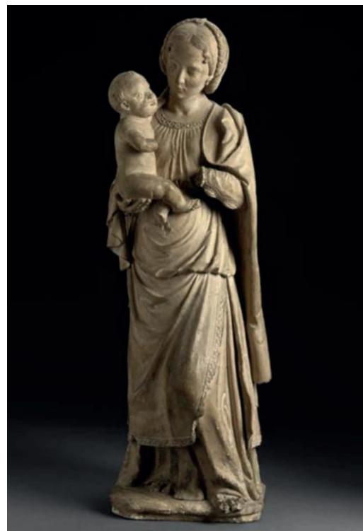
La Vierge à l'Enfant de Blois Deuxième quart du XVI e s. Terre cuite, 80 x 26 x 26 cm Blois, Château-musée

Cette exposition est le fruit d'un projet de recherche, Sculpture 3D , financé par la Région Centre-Val de Loire. Pendant trois ans, des historiens de l'art du Centre d'études supérieures de la Renaissance (Université de Tours, CNRS, Ministère de la Culture) et des chercheurs en informatique du Laboratoire d'Informatique Fondamentale et Appliquée de Tours ont développé des outils numériques au service de l'étude, de l'enseignement et de la valorisation du patrimoine sculpté de la Renaissance de la région. L'Université de Tours est fortement impliquée dans ce projet, particulièrement à travers deux de ses laboratoires de recherche : le Centre d'études supérieures de la Renaissance (CESR) et le Laboratoire d'Informatique Fondamentale et Appliquée de Tours (LIFAT). Il s'inscrit aussi dans le cadre du Programme Ambition-Recherche-Développement « Intelligence des Patrimoines », porté par le CESR.